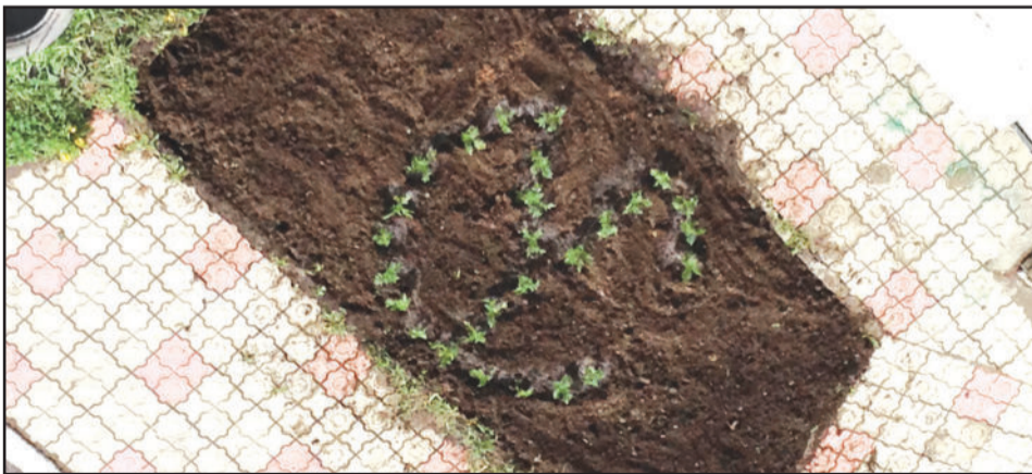
Клумба в виде логотипа ОАО «Северное управление ЖКС» появилась во дворе дома №309 А по улице Розы Люксембург. Таким образом жители решили поблагодарить сотрудников управляющей компании за отличное обслуживание многоквартирных домов.

Жители дома №309 А на ул. Розы Люксембург сделали во дворе цветочный логотип ОАО «Северное управление ЖКС»