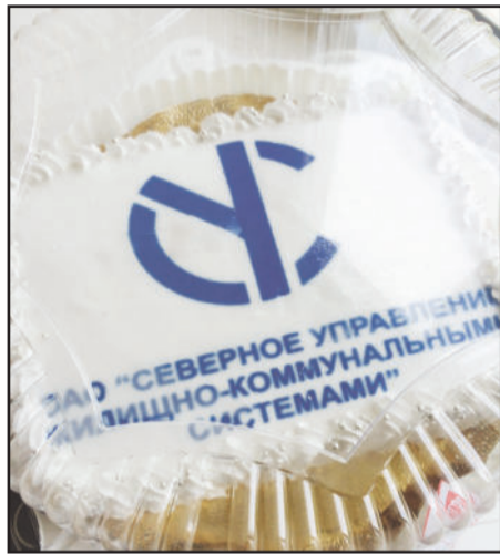
Этот торт сотрудники ОАО «Северное управление ЖКС» вручили победителям творческого конкурса.

Второе место присудили ребятам, занимающимся в кружке «Творческая мастерская» школы №36 г. Иркутска. Двор будущего дети смастерили при помощи аппликации из цветной бумаги – в нем много деревьев, цветов,