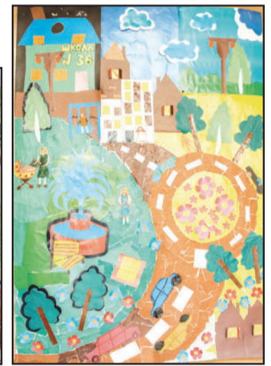
Это рисунки победителей конкурса «Мой двор в будущем». Авторы работ – учащиеся начальных классов школ Ленинского округа. Творчество было отмечено подарками и грамотами от ОАО «Северное управление ЖКС».