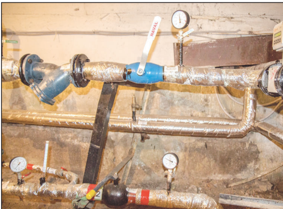
Манометры, термометры и запорная арматура должны быть в исправном состоянии. Это не просто комфорт, но и безопасность жителей.

находящегося в доме, это качественное предоставление коммунальных услуг жильцам дома – тепла и горячей воды. В сильные морозы хватит пары часов, чтобы разморозить систему, случись, к примеру, прорыв трубы. В Иркутске за последние годы крупных аварий на внутридомовых сетях не случалось, дома не размораживались в зимний период. Если бы вы побывали в подвалах жилых домов лет десять-пятнадцать назад, увидели бы огромную разницу. В то время многие подвалы были захламлены и затоплены, сети изношены. Сейчас во всех подвалах порядок, установлено новое