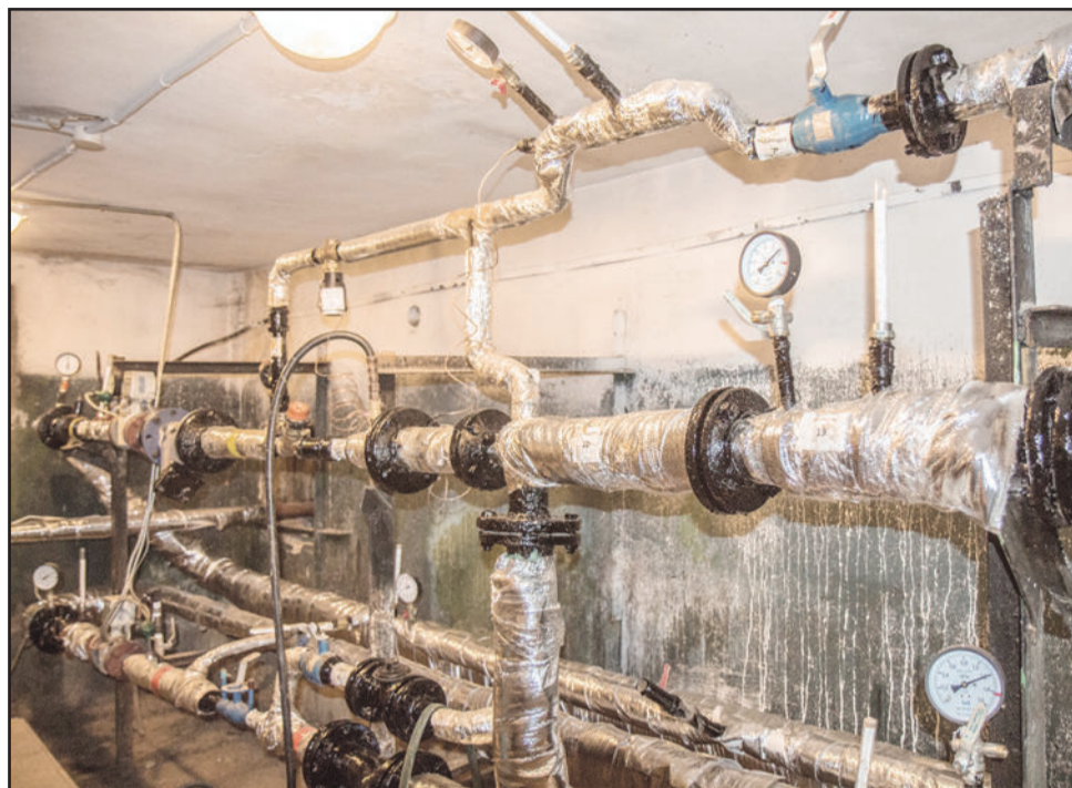
Трубы в подвале должны быть покрыты изоляционным слоем. Сейчас для этих целей используется современный материал термофлекс, который надежно защищает коммуникации от коррозии.

Но, как и во всех других вопросах, связанных с обслуживанием общедомового имущества, подготовка к отопительному сезону зависит не только от специалистов, но и от позиции собственников. Понятно, что каждому человеку хочется видеть красивый