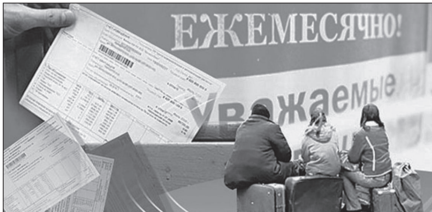
Огромные долги населения за услуги ЖКХ не позволяют управляющим компаниям проводить текущий ремонт в полном объеме. Именно поэтому со злостными неплательщиками ведется ежедневная работа – подробности об этом читайте на стр.6 →