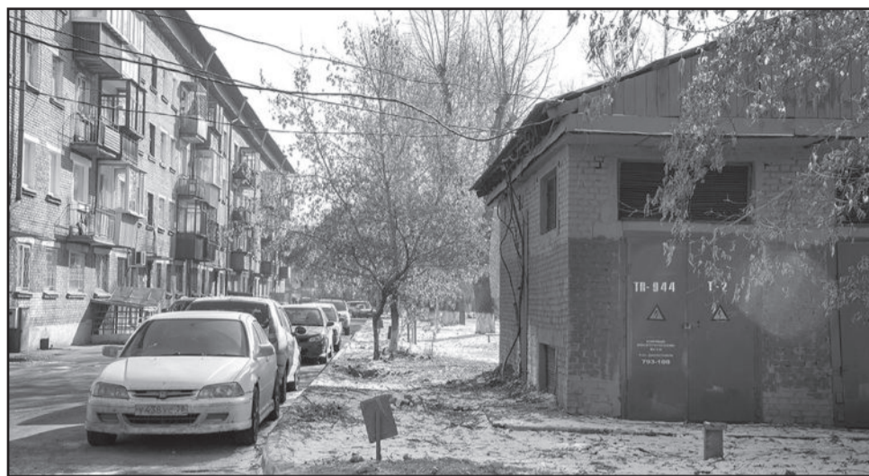
В начале ноября дерево, служащее «подпоркой» для связки проводов, спилили. Но, тем не менее, четыре провода все еще болтаются над головами прохожих.

Над дорогой продолжают висеть провода, и МЧС, и Ростехнадзор – все оказались бессильны. Южные электрические сети тоже не могут обрезать провода, так как владельцы торговых точек исправно оплачивают счета за потребленную электроэнергию. Кстати, это