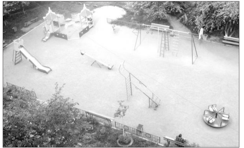
Согласитесь, этот двор похож на сказочный городок. На самом деле конечно же никакого волшебства здесь нет. Все, что вы видите, старались сделать жильцы дома № 216 по улице Севастопольской.

– Купила замок, привезла с дачи дверь и установила ее на подъезд. Уже позже скинулись на дверь с домофоном. Трудно было собирать на это деньги, многие отказывались, но две соседки сказали, что готовы быть спонсорами, лишь бы по подь-