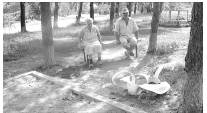
В жаркий день очень приятно посидеть в тени деревьев. Благодаря активности соседней из дома № 237а по улице Севастопольской такая возможность есть у всех местных жителей.