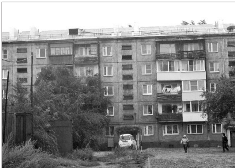
Этот дом, расположенный в Иркутске-II на улице Мира, вошел в программу по капитальному ремонту жилого фонда. Его жильцы очень радуются, что за приемлемую сумму им удалось полностью обновить кровлю. Правда, один из вопросов, связанный с установкой антенн на крыше, пока не теряет своей актуальности. Большинство соседей считают, что во избежание проломов шифера необходимо запретить установку индивидуальных антенн. Поэтому решили, что закроем выходы на чердаки железными люками.